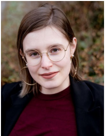
Anke De Cock Redacteur