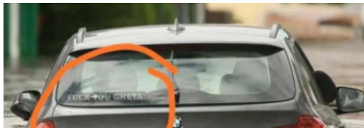
Foto van ondergelopen auto met anti-Greta Thunbergsticker is vals.

Na de zware overstromingen van enkele weken geleden circuleert een foto op sociale media. De foto toont een auto die half onder water staat. Op de achterraut van de auto plakt een sticker met “Fuck You Greta”, een verwijzing naar de klimaatactiviste Greta Thunberg. De auto lijkt dus eigendom te zijn van een “klimaatontkenner”, dus iemand die niet gelooft in de opwarming van de aarde. De recente overstromingen worden sterk gelinkt aan die klimaatopwarming.