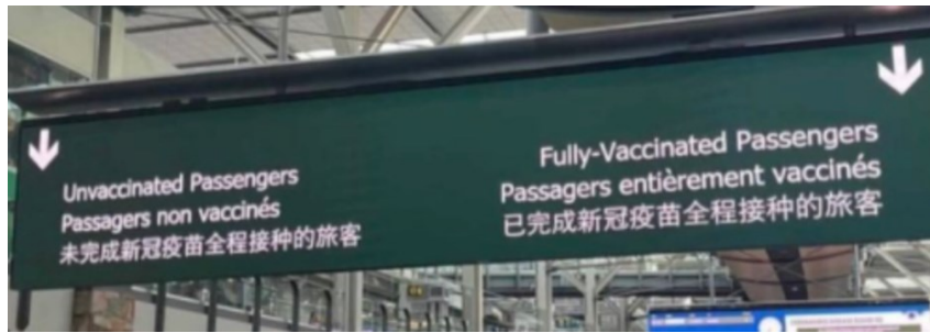
Foto van aparte wachtrijen voor gevaccineerden en niet-gevaccineerden is echt.

Bovenstaande foto circuleert op sociale media, vooral in anti-vaccinatiegroepen. Op de foto is een aankomsthal van een luchthaven te zien, waar aparte wachtrijen zijn voorzien voor niet-gevaccineerden en gevaccineerden. Er komt heel wat kritiek op de “medische apartheid” die de foto zou aantonen.