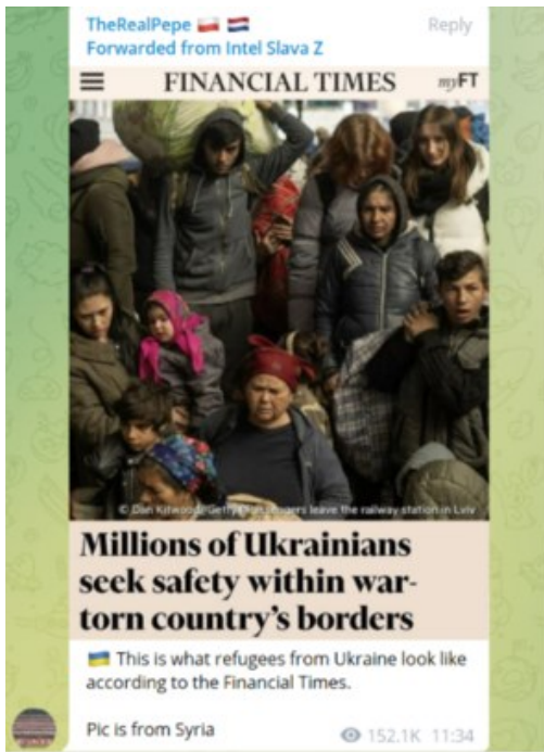
Foto Financial Times toont wel degelijk Oekraïense vluchtelingen

Op 25 maart publiceerde de Britse krant Financial Times een artikel over Oekraïense vluchtelingen. De foto die gebruikt werd in het artikel toont een groep vluchtelingen in de Oekraïense stad Lviv.